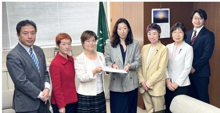
▲区長（中央）に申し入れをする党区議団

この事業は区内中小事業者に対し、光熱費の高騰による経営への影響を緩和し、経営の安定化を図るため、杉並区が光熱費（電気・ガス）の一部を助成するものです。 申請期限は12月末ですが、年末年始は商店や事業者が多忙な時期でもあります。助成金事